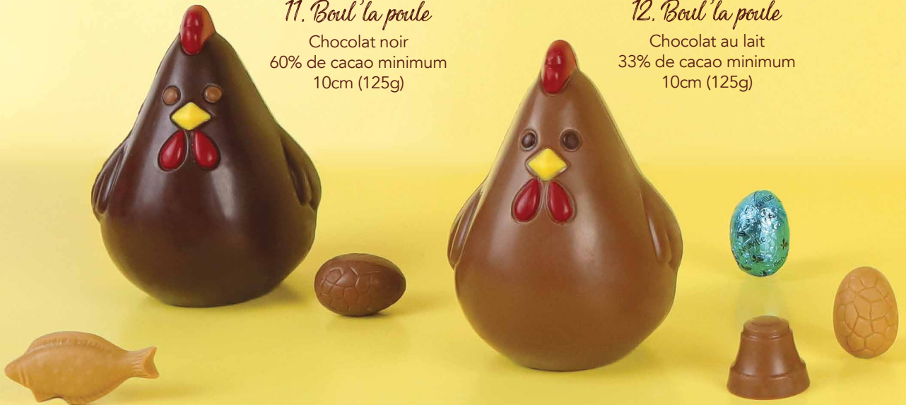
12. Boul'la poule Chocolat au lait 33% de cacao minimum 10cm (125g)