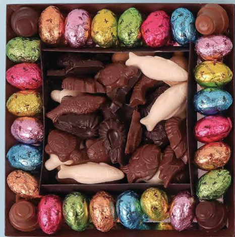
17. Grand plateau (345g)

Et si finalement nous célébrions Pâques avec nos irrésistibles œufs et cloches en chocolat ? Que vous les cachez pour une chasse aux œufs ou que vous les offriez en cadeau, nos chocolats sont prêts à égayer vos festivités !