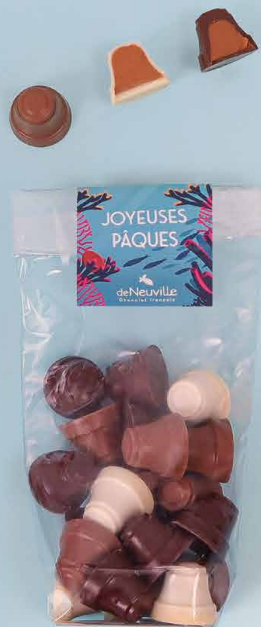
LE PRALINÉ PÉTILLANT

Praliné amandes et noisettes, au chocolat noir, lait ou blanc (150g)