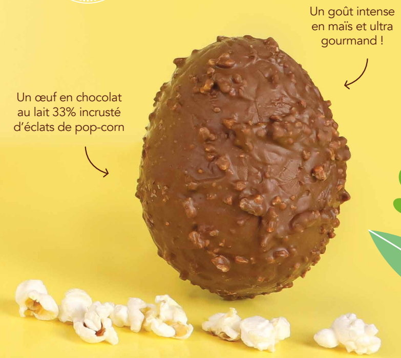
14. Œuf pop-corn 13cm (115g)

Un goût intense en maïs et ultra gourmand !